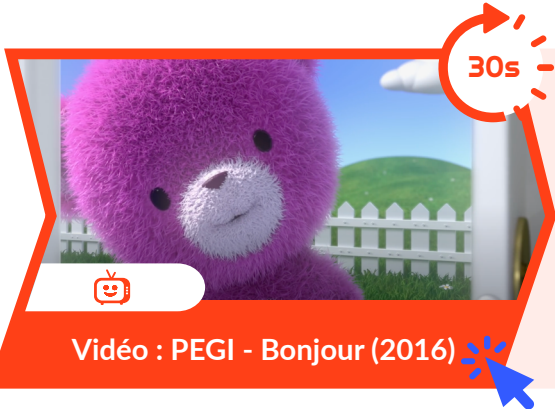
Vidéo : PEGI - Bonjour (2016)

Pour commencer, cette vidéo permet d'ouvrir la discussion sur la signalétique PEGI.