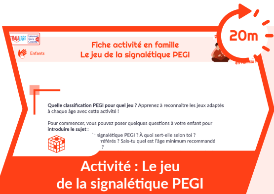
Activité : Le jeu de la signalétique PEGI

Vous pouvez maintenant approfondir le sujet avec cette activité, pour en apprendre plus sur la signalétique PEGI, à travers une activité ludique !